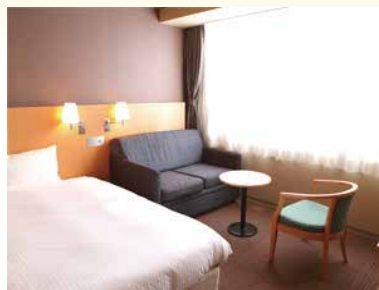
デラックスシングルルーム

Breakfast 毎日手作りの朝食バイキング で元気に出発!地元宮城の食 材を多数使用しました。